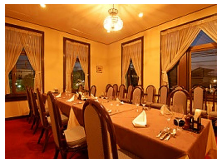
会場のとどろき亭

新しいクラブ員とゲストの皆さんに2つの金沢東と金沢というクラブがのそれぞれに籍している会員の雰囲気を感じていただくことができた。確認した訳ではないがそれがよく現れていたと思う。