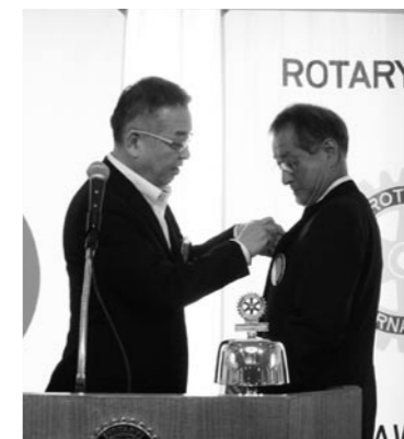
半田会長から別川新会長へ