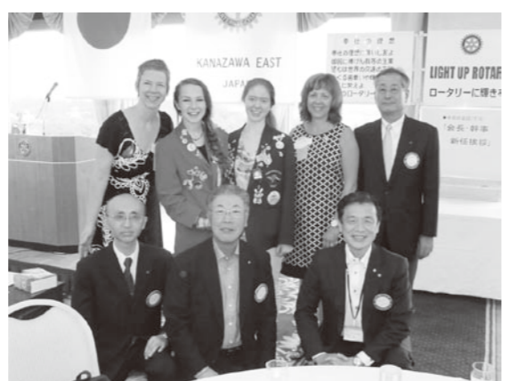
グレースー最後の例会にお母様来会